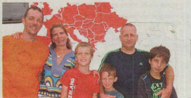
La famille Sachot au gré des rencontres.